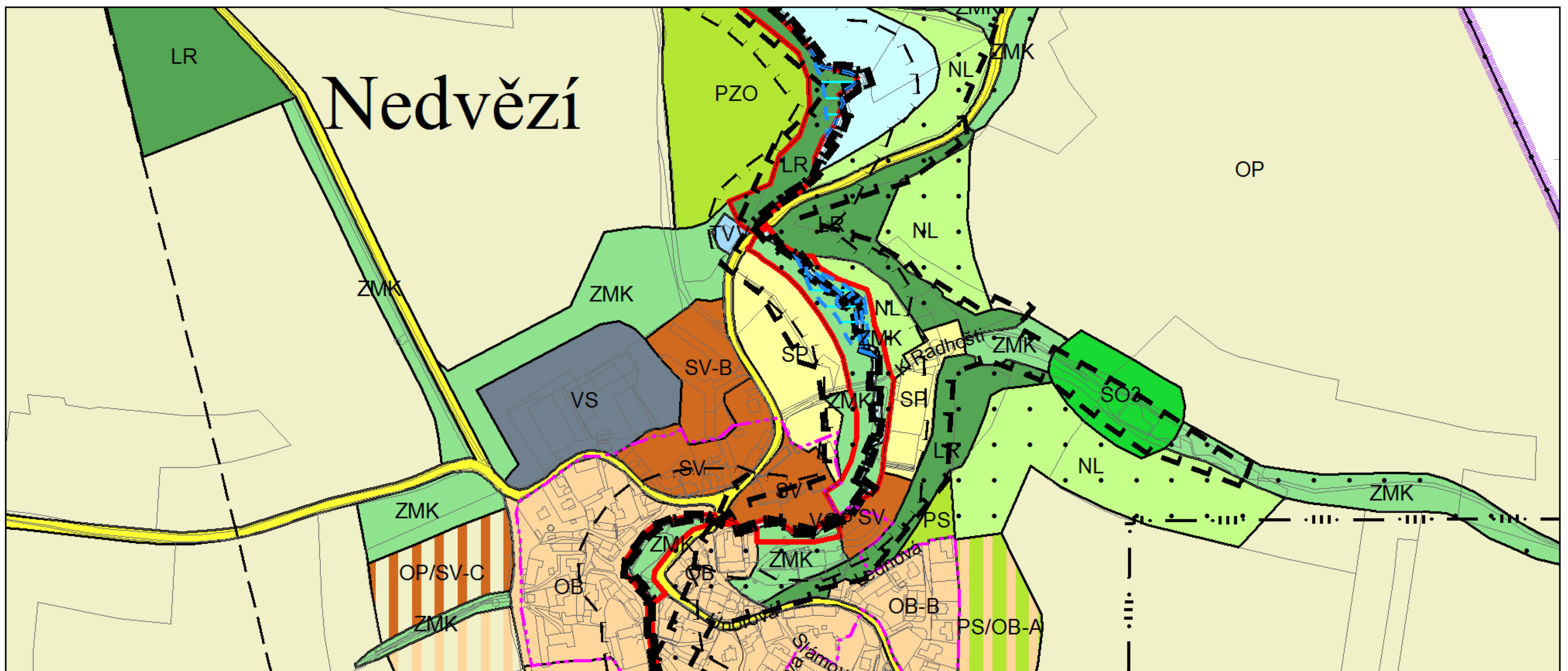
Výkres č. 4 – Plán využití ploch, platný stav k 1. 1. 2017